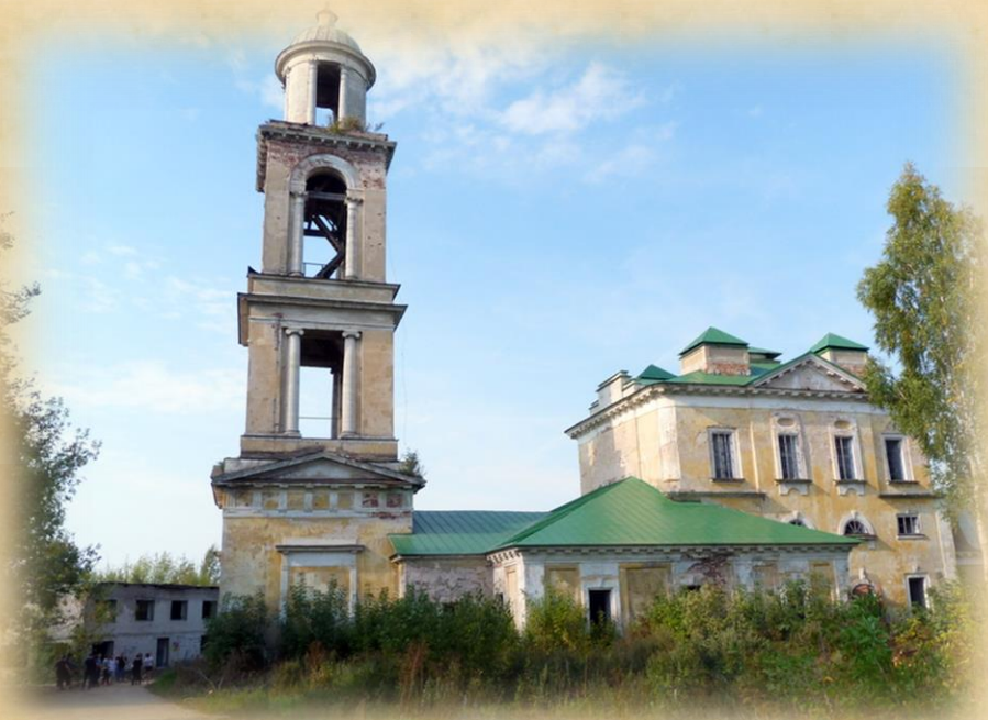
Никольская (Преображенская) церковь, г. Старица, ул. Набережная р. Волга St. Nicholas Church, Embankment of riv. Volga St.

Никольско-Преображенская церковь или Николая Чудотворца построена в 1784 - 1814 годах на месте существовавших ранее деревянной Никольской и каменной Казанской церквей. Колокольня сооружена в 1843 году. Здание сохранилось сравнительно неплохо, хотя и оно не избежало разрушений: после войны храм лишился куполов. На сегодняшний день храм восстанавливается.