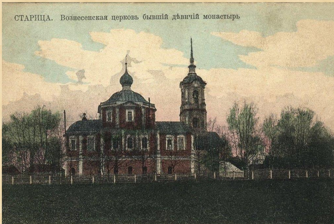
СТАРИЦА. Вознесенская церковь бывший девичий монастырь