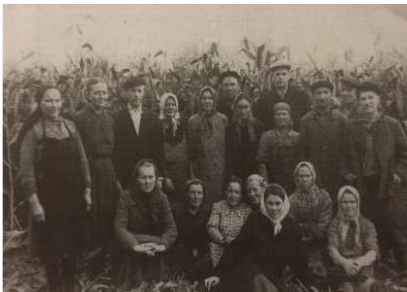
Полеводческая бригада колхоза «Прогресс». 1960 г.