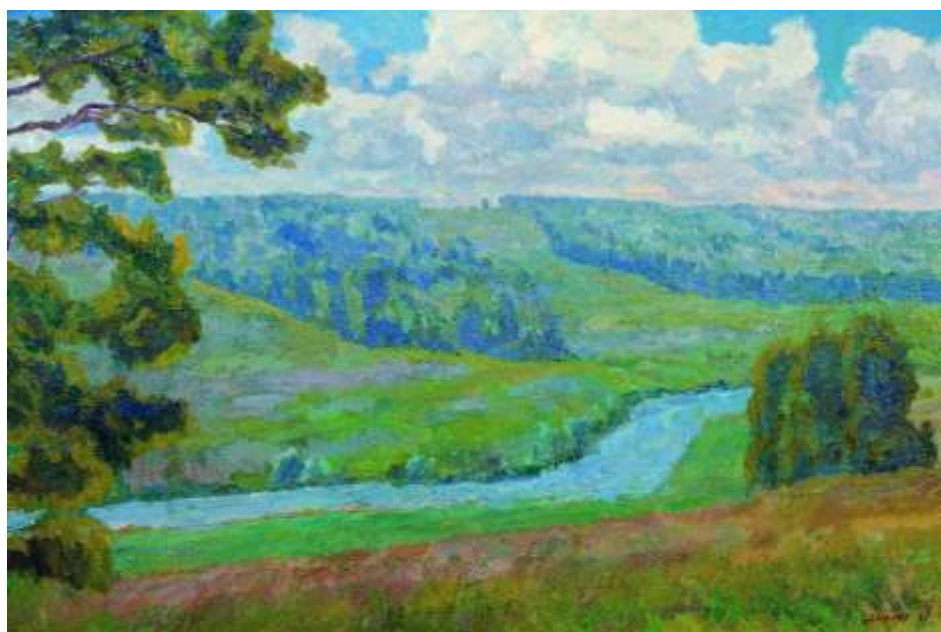
Картина Ефрема Ивановича Зверькова

С 1940 года Е. И. Зверьков — постоянный участник всесоюзных, всероссийских, московских и международных выставок. Жил и работал в Москве. Скончался 31 июля 2012 года. Похоронен на Новодевичьем кладбище Москвы. Работы художника представлены в крупнейших собраниях России: в ГТГ и ММСИ, ГРМ, во многих отечественных художественных музеях, в государственных и частных коллекциях Франции, Болгарии, Италии, Бельгии, США, Японии, Китая и других стран.