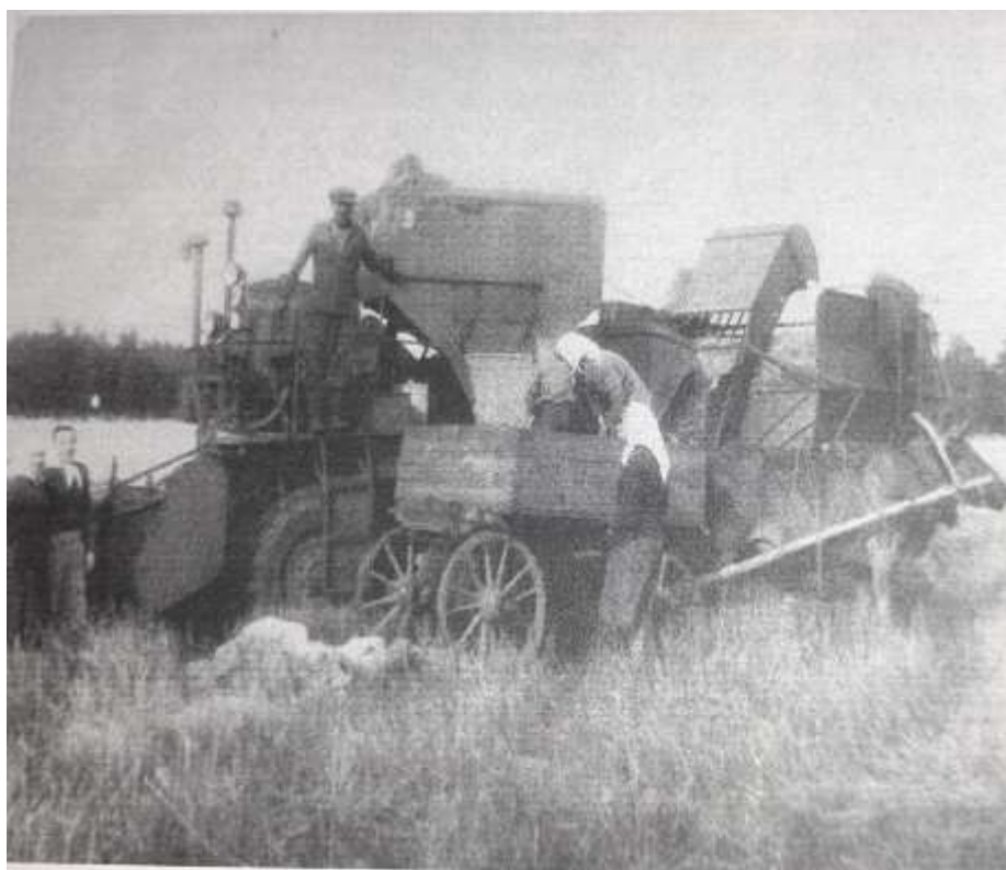
Уборочная. 1957 год.