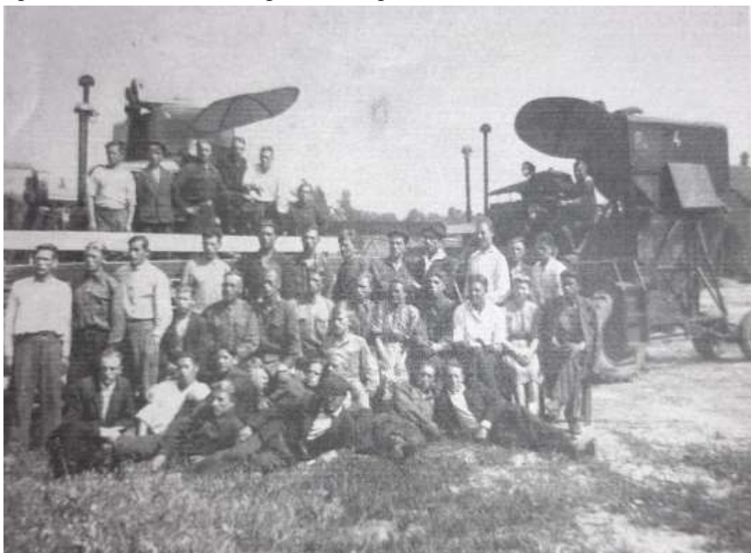
Механизаторы колхоза «Прогресс» после объединения 1950 года.