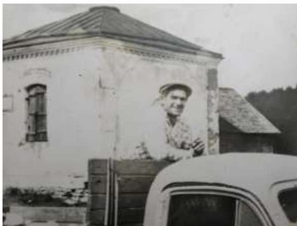
Фотография часовни Пресвятой Богородицы д.Нестерово