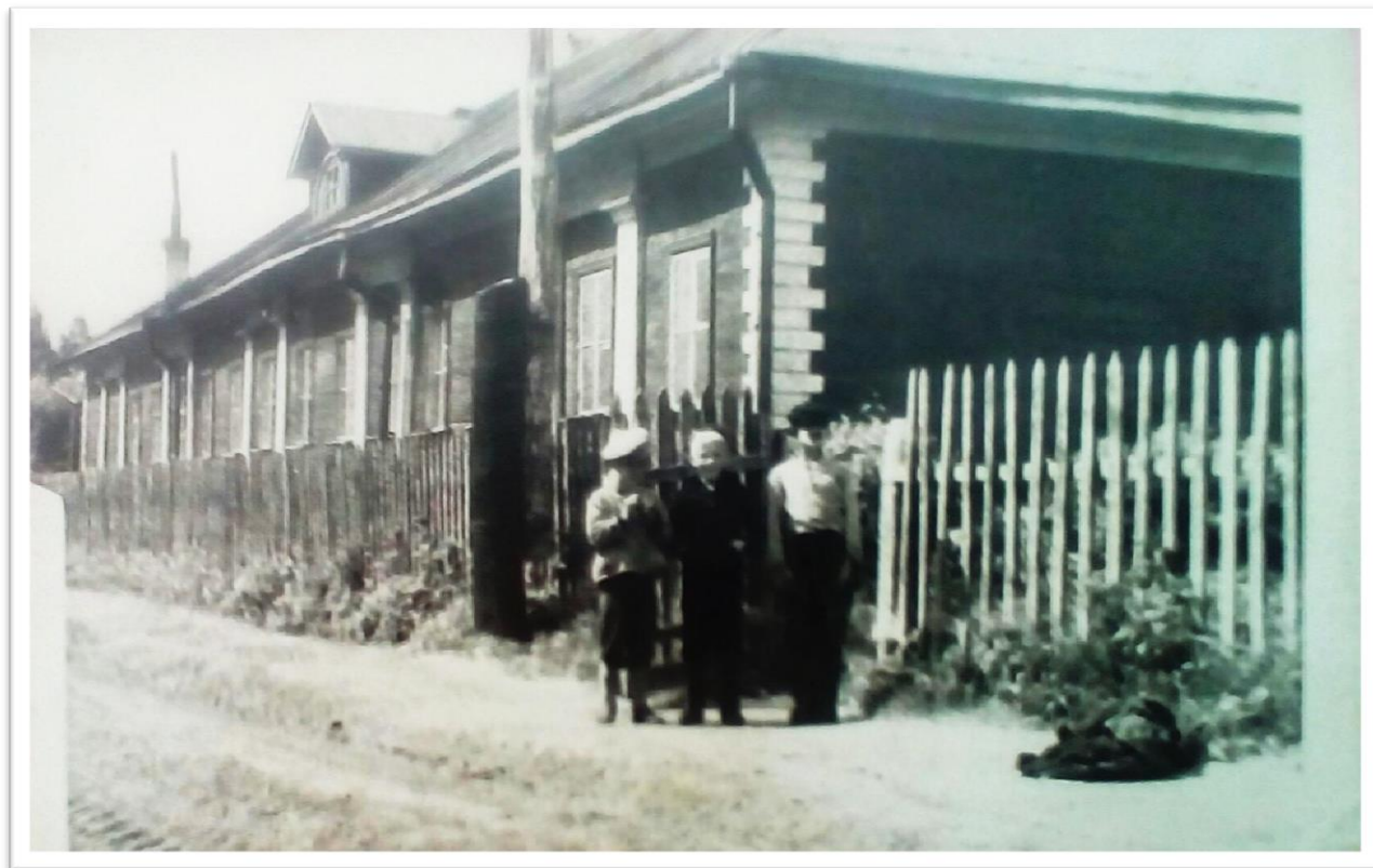
Новская восьмилетняя школа 1965 г.

До 2004 г. барском доме находилась Новская общеобразовательная школа. Сейчас это здание разрушено.